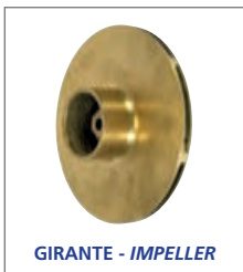
GIRANTE - IMPELLER